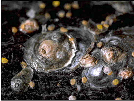
Piojo de San José